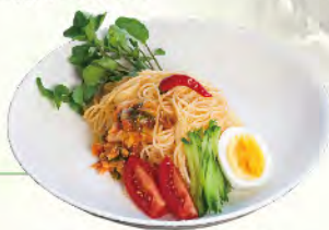
全国米粉料理コンテスト 優秀賞「田守り」